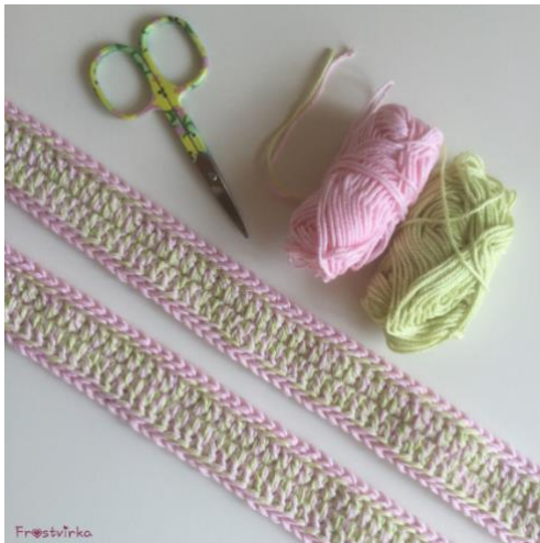
Bild från en av mina tidigare väskor där samma mönster för handtag använts.

Virka ett varv runt handtaget med sm i bakre mb på varje st. Även detta varv med dubbla trådar och nål 4. Jag använde färg C och D till detta.